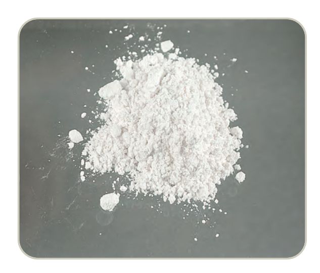
Heroína en polvo blanco