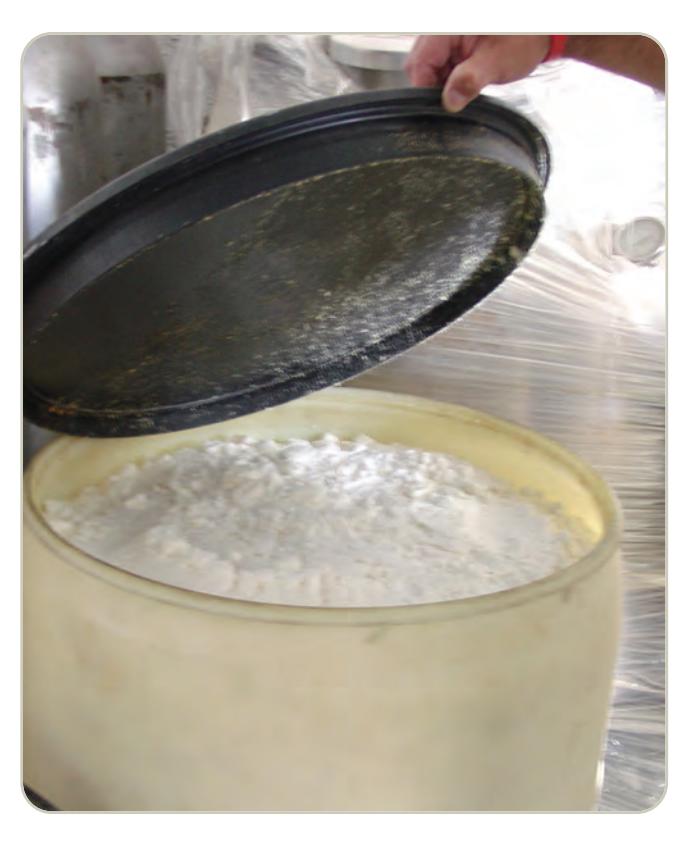
Metanfetamina en forma elaborada

La metanfetamina regular es una píldora o polvo. La metanfetamina cristal es similar a fragmentos de vidrio o "rocas" blanco azuladas brillantes de diversos