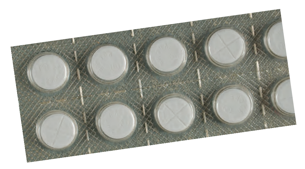
Blíster de comprimidos de Rohypnol®

El Rohypnol® es una sustancia de Clasificación IV bajo la Ley de Sustancias Controladas. La fabricación, venta, uso o importación a los Estados Unidos de Rohypnol® no está aprobada. Sin embargo, en otros países se fabrica y se comercializa legalmente. Las sanciones por posesión, tráfico y distribución que involucran un gramo o más son las mismas que las de las drogas de Clasificación I.