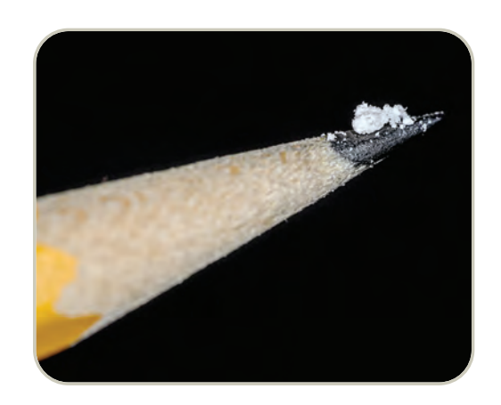
Una dosis letal de fentanilo

Desde 2011 hasta 2018, tanto las sobredosis fatales asociadas con el abuso de fentanilo y los análogos del fentanilo producidos clandestinamente, como los hallazgos policiales aumentaron notablemente. Según los Centros para el Control y la Prevención de Enfermedades (CDC), tanto en 2011 como en 2012, los análogos del fentanilo estuvieron involucrados en aproximadamente 2.600 muertes por sobredosis de drogas, pero desde 2012 hasta 2018, el número de muertes por sobredosis de drogas con fentanilo y otros opioides sintéticos aumentó dramáticamente cada año. Más recientemente, se ha producido un resurgimiento del tráfico, la distribución y el abuso de fentanilo y análogos de fentanilo producidos ilícitamente con un aumento dramático asociado de muertes por sobredosis que oscilan entre 2.666 en 2011 y 31.335 en 2018.