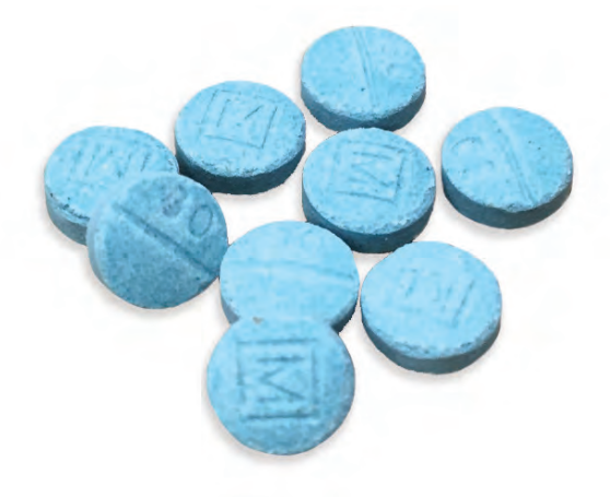
Tabletas de oxicodona falsificadas producidas clandestinamente que contienen fentanilo.

El abuso de opioides sintéticos de producción