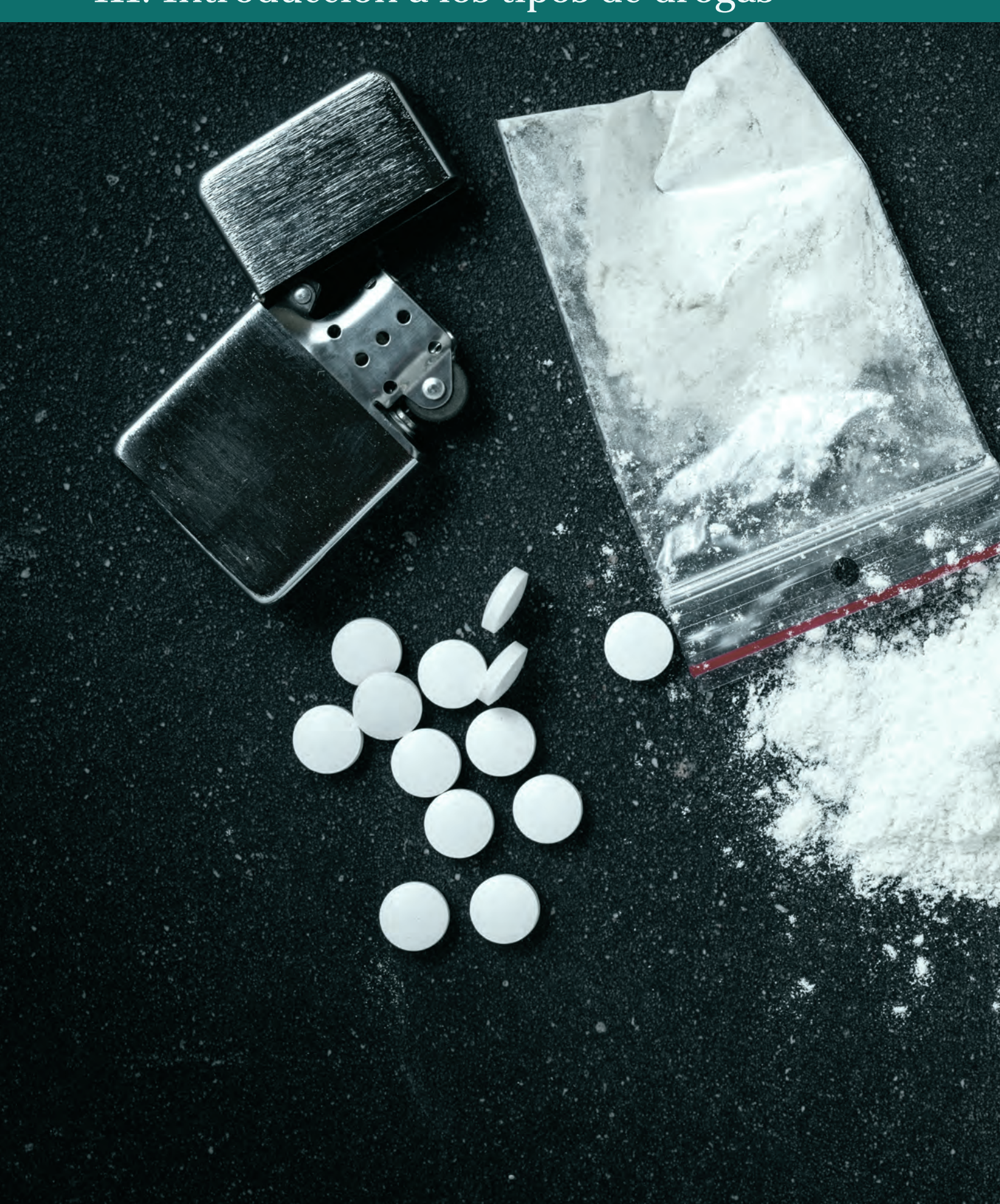
III. Introducción a los tipos de drogas