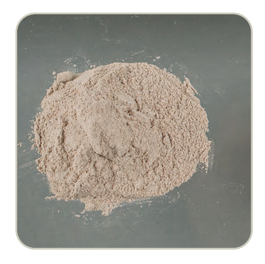
Heroína en polvo café