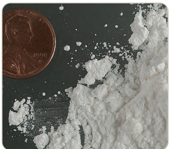
Polvo de cocaína

El clorhidrato de cocaína (HCI) generalmente se distribuye como un polvo blanco y cristalino. A menudo se diluye ("se corta") con diversas sustancias, la más destacada es el