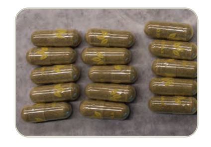
Cápsulas de kratom