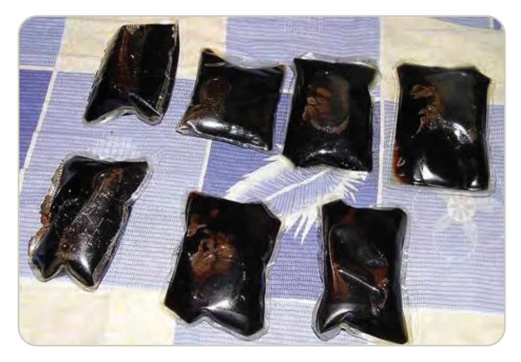
Paquetes de heroína líquida