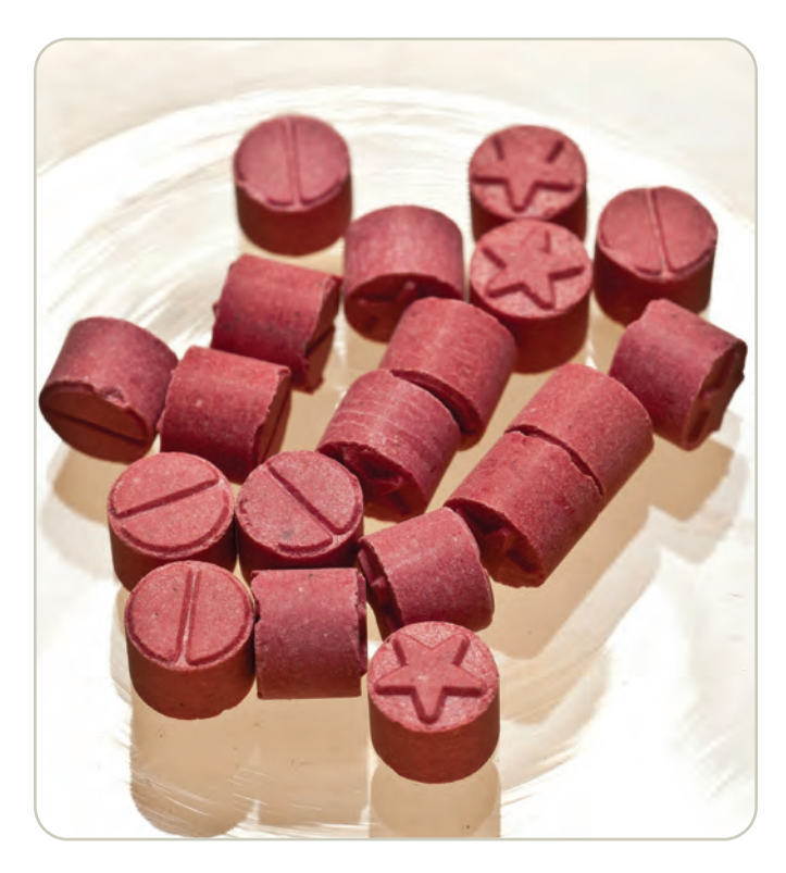
MDMA/Pastillas de éxtasis

Muchos alucinógenos son sustancias de Clasificación I bajo la Ley de Sustancias Controladas, lo que significa que tienen un alto potencial para el abuso, no tienen ningún uso médico aceptado en la actualidad en los Estados Unidos y carecen de la seguridad aceptada para su uso bajo supervisión médica.