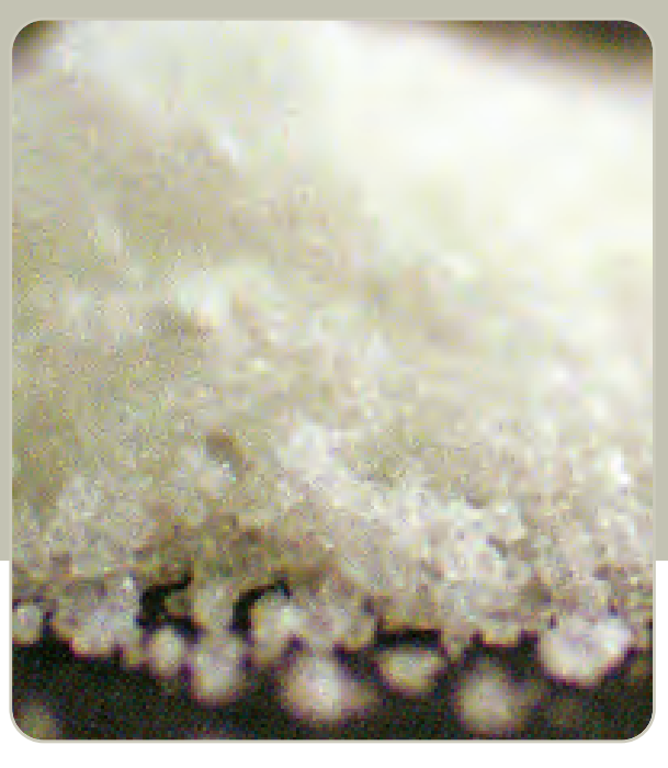
Sales de Baño

Las catinonas sintéticas se fabrican en Asia Oriental y han sido distribuidas a niveles mayoristas en Europa, Norte América, Australia y otras partes del mundo.