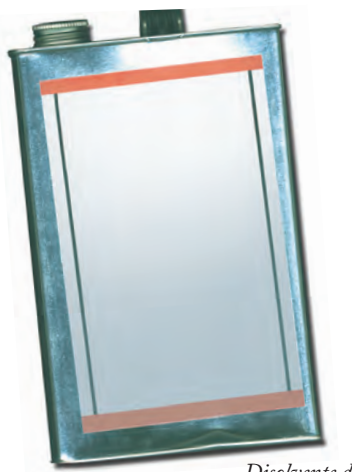
Disolvente de pintura

Los productos domésticos comunes como pegamento, líquido para encendedores, líquidos de limpieza y pintura producen vapores químicos que pueden inhalarse.