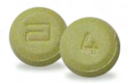
Píldoras de hidromorfona