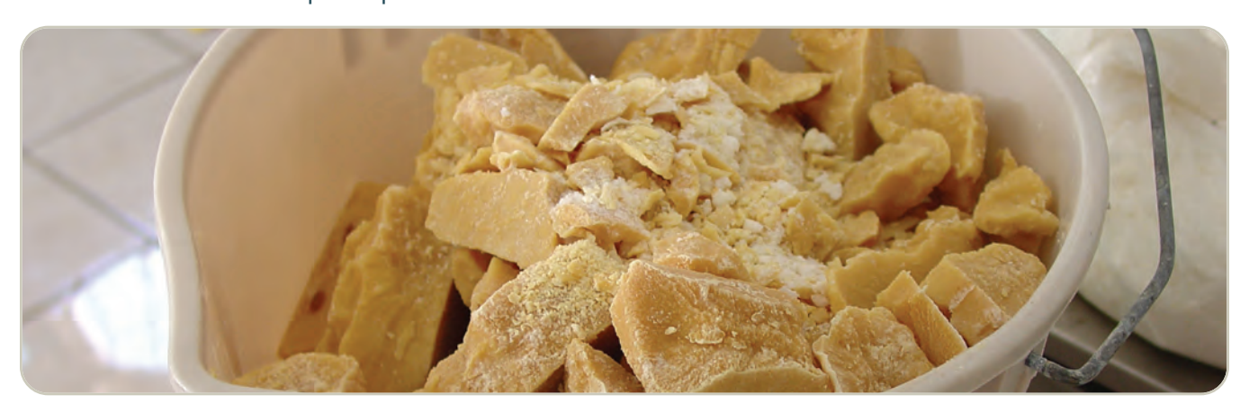
Metanfetamina en forma elaborada

La metanfetamina es un estimulante de Clasificación II, bajo la Ley de Sustancias Controladas, lo que significa que tiene un alto potencial de abuso y un uso médico actualmente aceptable (en productos aprobados por la FDA). Está disponible solo con receta médica que no puede volver a surtirse. Actualmente, hay solo un producto legal que contiene metanfetamina, el Desoxyn®. Se comercializa en tabletas de 5, 10 y 15 miligramos (formulaciones de liberación inmediata y liberación prolongada) y tiene un uso muy limitado en el tratamiento de la obesidad y el TDAH.