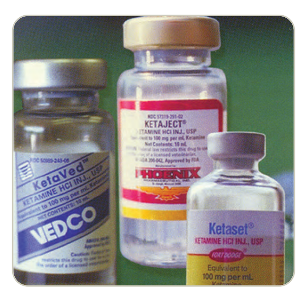
Frascos con ketamina líquida

La ketamina, junto con otras "drogas de club" se ha vuelto popular entre los adolescentes y adultos jóvenes en los centros nocturnos y raves. Es producida de manera comercial en forma de polvo o líquida. La