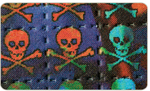
Papel secante para LSD

Durante la primera hora después de su ingestión, los consumidores pueden experimentar cambios visuales con cambios extremos en el estado de ánimo. Mientras duran las alucinaciones el consumidor puede sufrir alteraciones en la percepción de la profundidad y el tiempo, acompañadas por una percepción distorsionada de la forma y el tamaño de los objetos, los movimientos, colores, sonidos, el tacto y la imagen corporal de sí mismo.