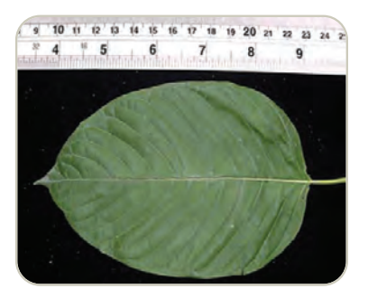
Hoja de árbol de kratom