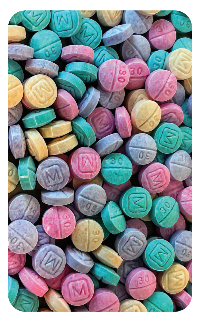
Pastillas falsas de oxicodona M30 que contienen fentanilo

El fentanilo es un narcótico de la Clasificación Il bajo la Ley de Sustancias Controladas de los Estados Unidos de 1970.