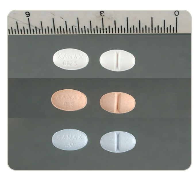
Comprimidos ranurados de Xanax 0.25,0.5 y 1 mg

Generalmente, los productos farmacéuticos legítimos son desviados al mercado ilegal. Los adolescentes pueden obtener depresores del botiquín de casa, o a través de familiares, amigos, internet, doctores y hospitales.