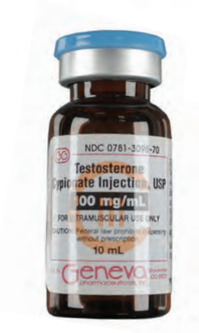
Inyección de cipionato de testosterona, USP