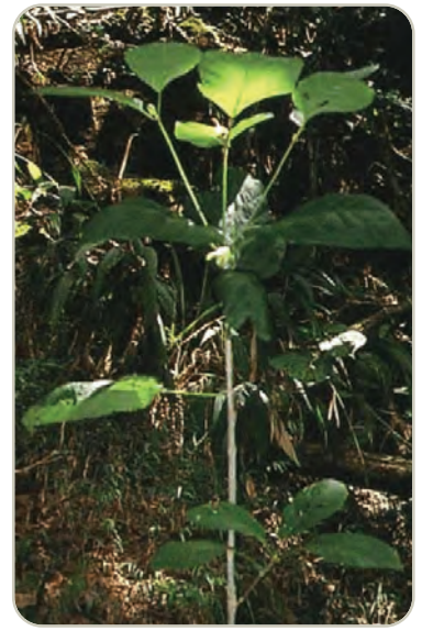
Árbol de kratom

Puede ocasionar náuseas, comezón, sudoración, resequedad de la boca, estreñimiento, aumento de la orina, taquicardia, vómitos, mareo y pérdida de apetito. Los consumidores de kratom también han experimentado anorexia, pérdida de peso, insomnio, toxicidad hepática, convulsiones y alucinaciones.