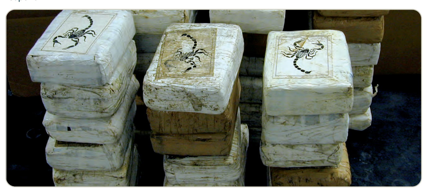
Ladrillos de cocaína, incautados por la DEA

La cocaína es una droga de Clasificación II bajo la Ley de Sustancias Controladas, lo que significa que tiene un alto potencial de abuso y un uso médico aceptado en la actualidad en los Estados Unidos. La solución de clorhidrato de cocaína (4 por ciento y 10 por ciento) se usa principalmente como anestésico local del tracto respiratorio superior. También se usa para reducir el sangrado de las membranas mucosas de la boca, garganta y cavidades nasales. Sin embargo, actualmente se han desarrollado productos más efectivos para estos propósitos, por lo que el uso médico de la cocaína en los Estados Unidos es raro.