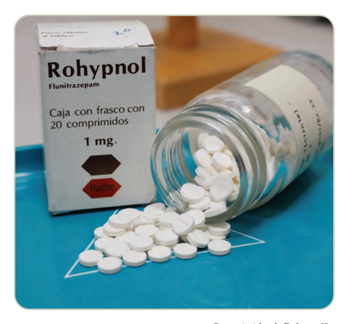
Comprimidos de Rohypnol®

El Rohypnol también se usa indebidamente para incapacitar física y psicológicamente a las víctimas