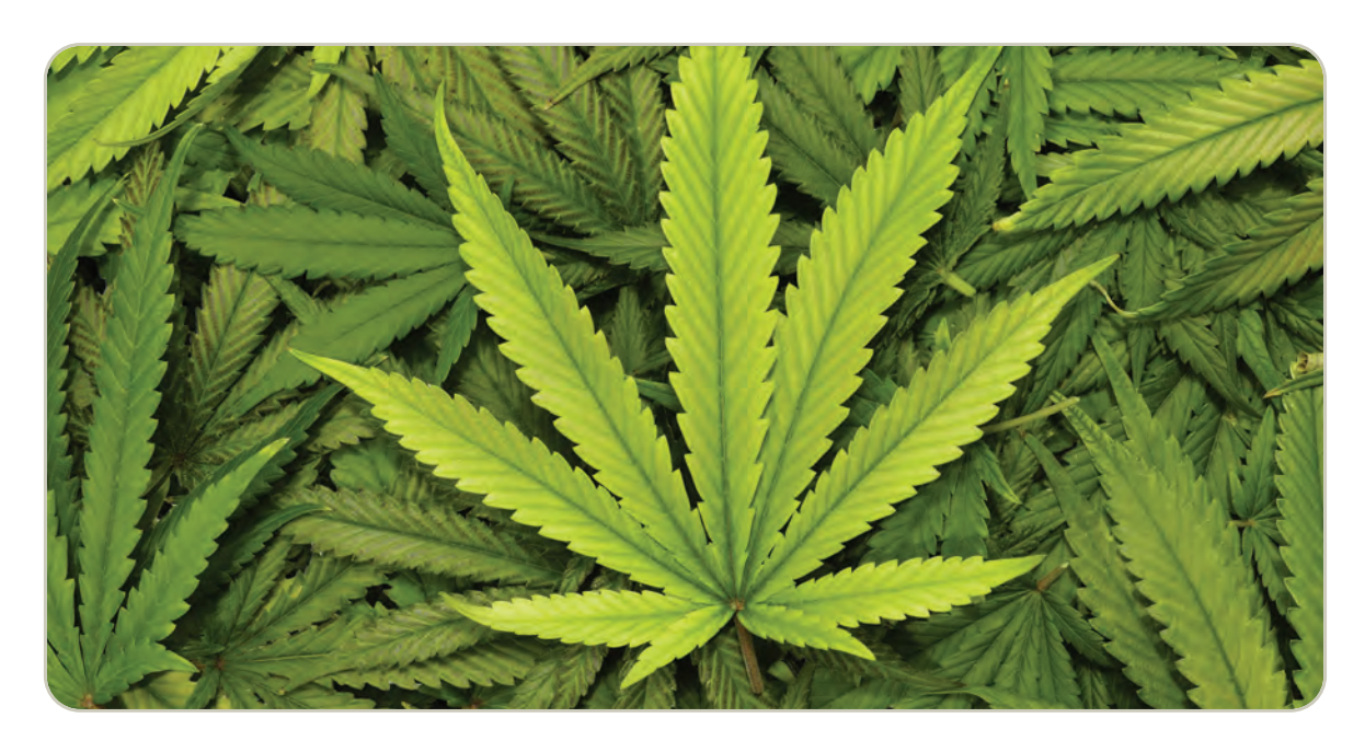
Hojas de marihuana