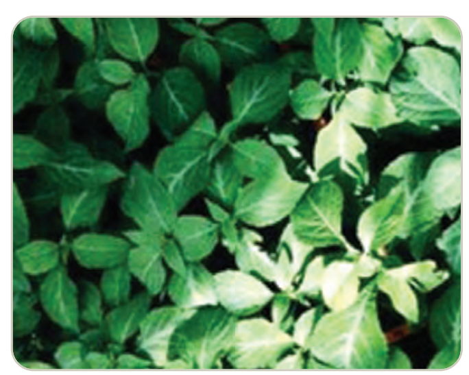
Hojas de la planta Salvia divinorum

La planta tiene hojas verdes en forma de espada similares a las de la menta. Las plantas pueden alcanzar más de un metro de altura, tener grandes hojas verdes, tallos huecos cuadrados y flores blancas con cálices púrpuras.