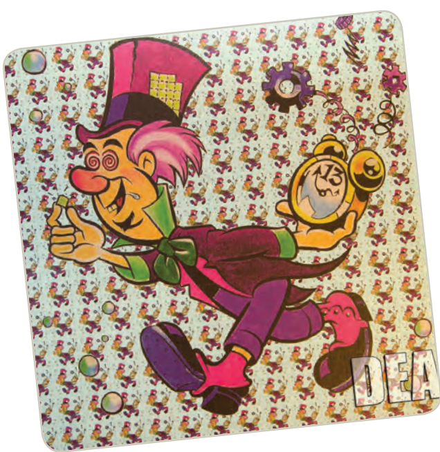
Papel secante con LSD