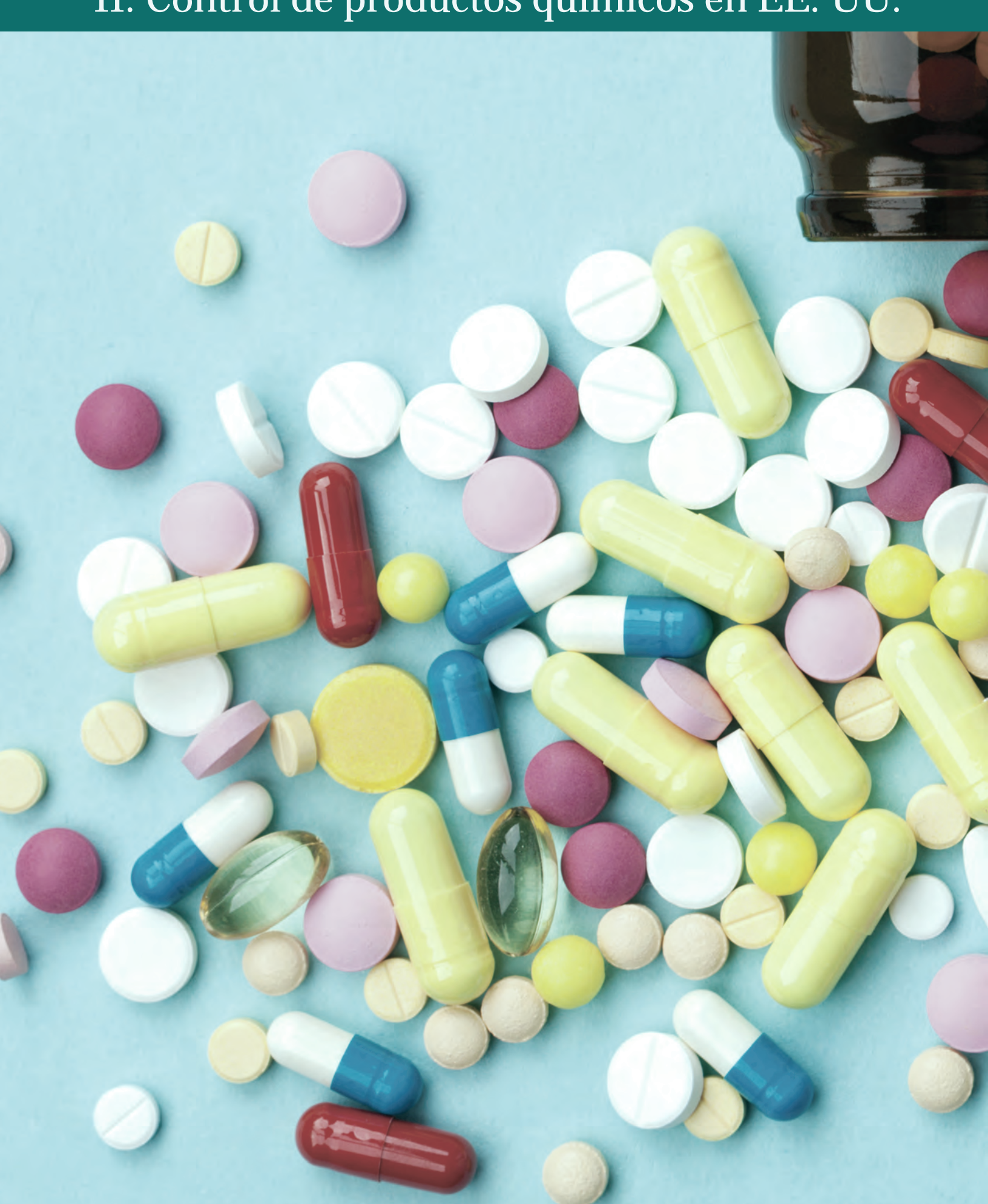
II. Control de productos químicos en EE. UU.