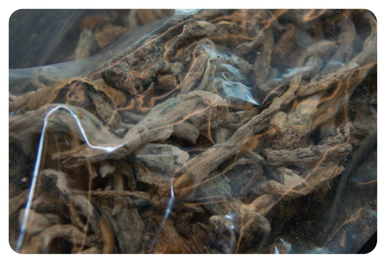
Setas de psilocibina

La psilocibina es una sustancia de Clasificación I de acuerdo a la Ley de Sustancias Controladas, lo que significa que tiene un alto potencial de abuso, no cuenta con autorización para uso médico para tratamiento en Estados Unidos y carece de seguridad para uso bajo supervisión médica.