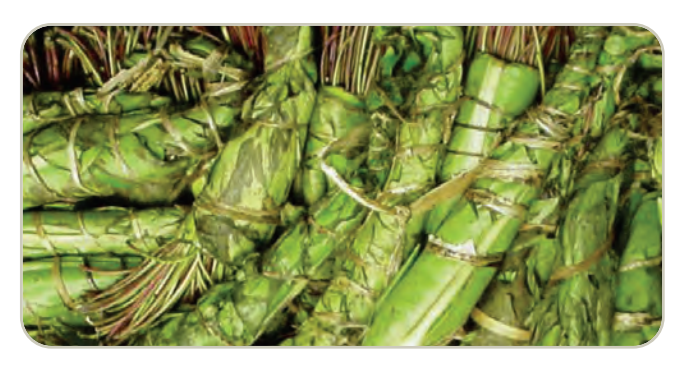
Planta de Khat

Generalmente se mastica como tabaco, se retiene en la mejilla y se mastica en forma intermitente para liberar la droga activa, que produce un efecto