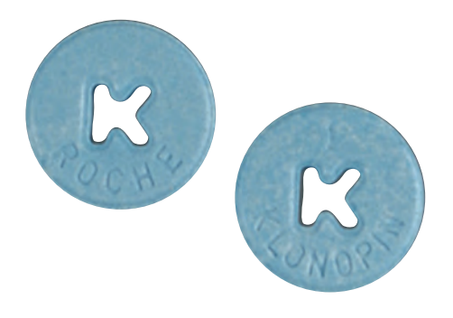
Comprimidos de Klonopin 5 mg

La mayoría de los depresores son sustancias controladas comprendidas en las Clasificaciones I, II, III o IV de la Ley de Sustancias Controladas, dependiendo del riesgo de abuso y de su uso médico aceptado actualmente. Muchos tienen usos médicos aprobados por la FDA. En los Estados Unidos, el Rohypnol® y el Quaaludes® no se fabrican ni se comercializan legalmente, y no tienen un uso médico aceptado en los Estados Unidos.