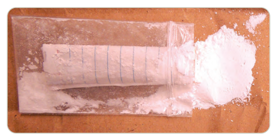
Opioide sintético en polvo U-47700.

clandestina se asemeja al de la heroína y a la prescripción de opioides analgésicos. Muchos de estos opioides sintéticos de producción ilegal son más potentes que la morfina y la heroína por lo tanto, tienen el potencial de ocasionar una sobredosis fatal.