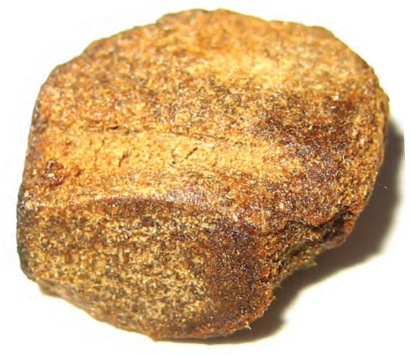
Concentrado de marihuana

Hay muchos métodos para convertir o "manufacturar" la marihuana en concentrados. Uno es el proceso de extracción con gas butano. Este proceso es particularmente peligroso porque utiliza gas butano para extraer el THC de la planta de cannabis, y dado que se trata de un gas altamente inflamable, el proceso ha resultado en violentas explosiones. Se han reportado laboratorios de extracción de THC en todo el país,