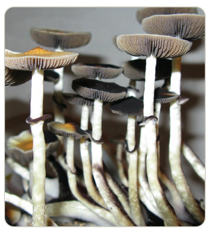
Setas de psilocibina

Náuseas, vómito, debilidad muscular y falta de coordinación